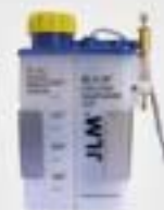
7. Συσκευή λίπανσης (προαιρετικά)