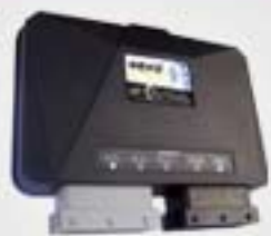
1. Κεντρική μονάδα