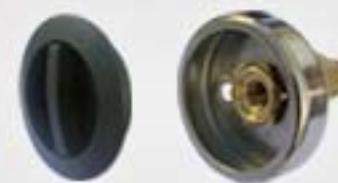
9. Μονάδα Πλήρωσης