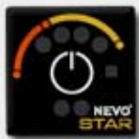
2. Control Panel