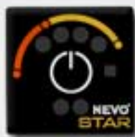
2. Control Panel