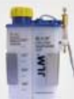
7. Συσκευή λίπανσης (προαιρετικά)