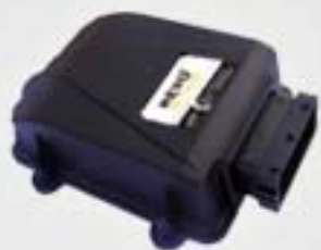
1. Κεντρική μονάδα