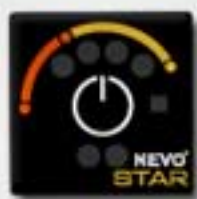
2. Control Panel