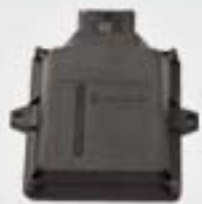
1. Κεντρική μονάδα