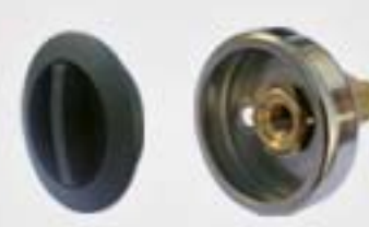
9. Μονάδα Πλήρωσης