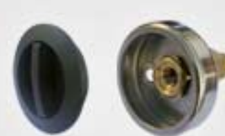
9. Μονάδα Πλήρωσης