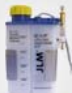
7. Συσκευή λίπανσης (προαιρετικά)