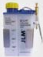
7. Συσκευή λίπανσης (προαιρετικά)