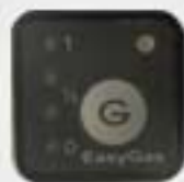
2. Control Panel