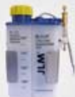
7. Συσκευή λίπανσης (προαιρετικά)