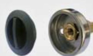
9. Μονάδα Πλήρωσης