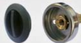
9. Μονάδα Πλήρωσης