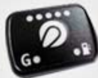
2. Control Panel