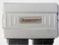
1. Κεντρική μονάδα