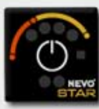
2. Control Panel