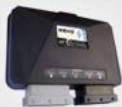
1. Κεντρική μονάδα