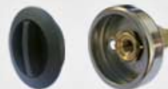
9. Μονάδα Πλήρωσης