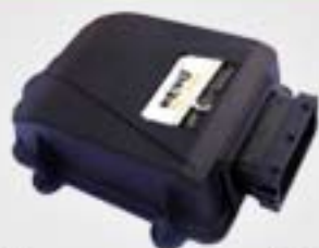
1. Κεντρική μονάδα