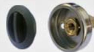
9. Μονάδα Πλήρωσης