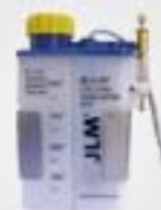
7. Συσκευή λίπανσης (προαιρετικά)