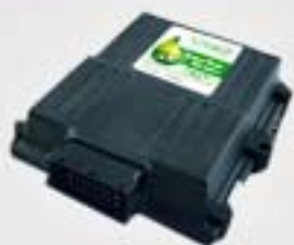
1. Κεντρική μονάδα